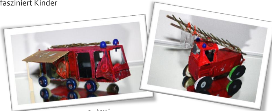
Kita „Am Seeberg“

Aus 7 Kindertagesstätten, mit insgesamt 13 Modellen, haben sich unsere kleinen Helden